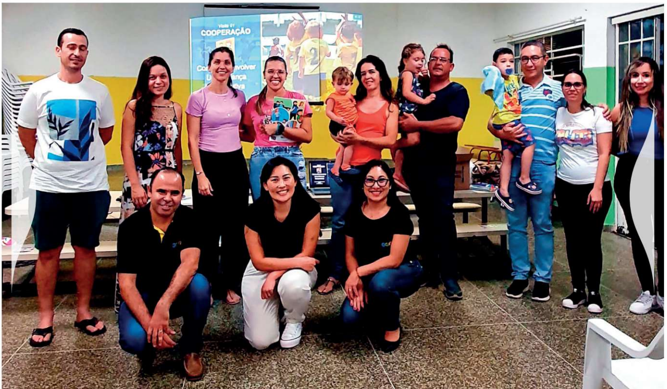
Figura 2 – Reunião do Programa EDF, que acontece nas escolas de Educação Infantil da rede pública municipal.