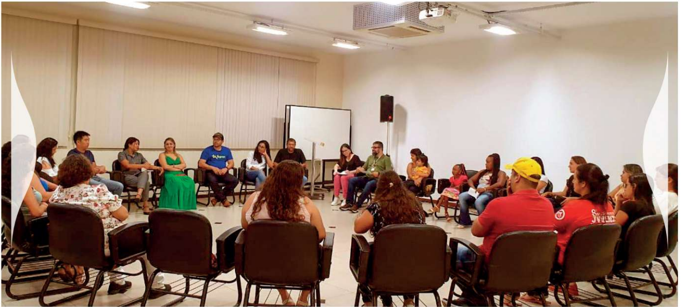
Figura 5 – Fotos dos Grupos Focais realizados em outubro de 2023, com 50 adultos participantes da EDF.