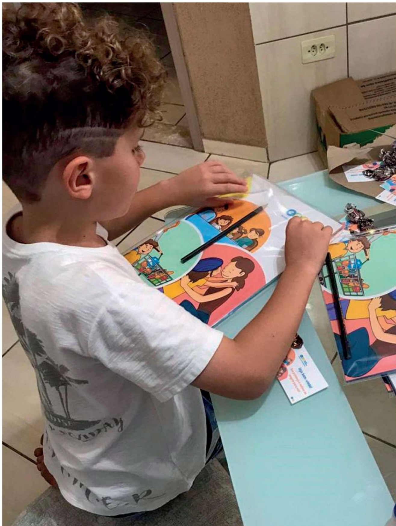
Figura 4 – Registro de criança com as apostilas da Escola da Família (foto autorizada pelos responsáveis).