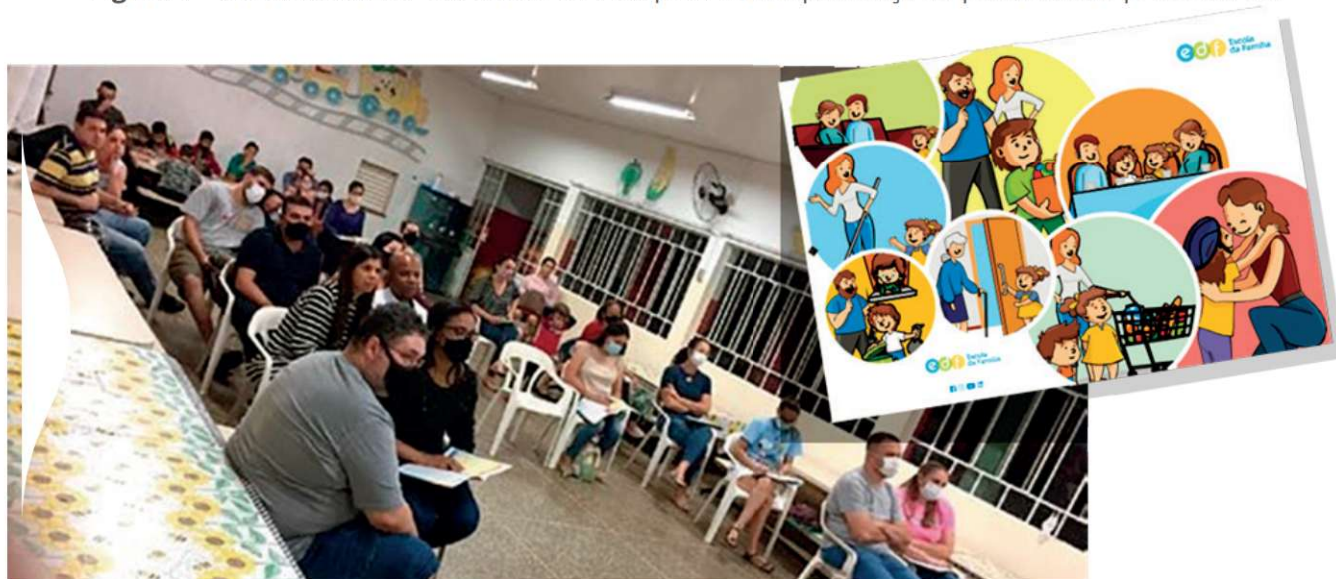
Figura 1 – Reunião da EDF em escola de Pompeia, com a presença de pais, mães e professores.

Em seu quarto ano de execução, hoje a Escola da Família é um programa em fase de consolidação: são contabilizadas mais de 1000 pessoas que passaram por suas atividades nas Escolas de Educação Infantil das cidades de Pompeia, Oriente, Quintana, Herculândia e Tupã (incluindo pais, mães, avós e avôs, facilitadores capacitados, professores e até mesmo diretoras de escolas).