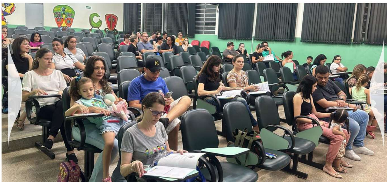
Figura 6 – Reunião em escola para apresentação do Programa Escola da Família.

“ Precisamos aprender a olhar as crianças de uma outra forma. A Escola da Família me ajudou com isso ”.